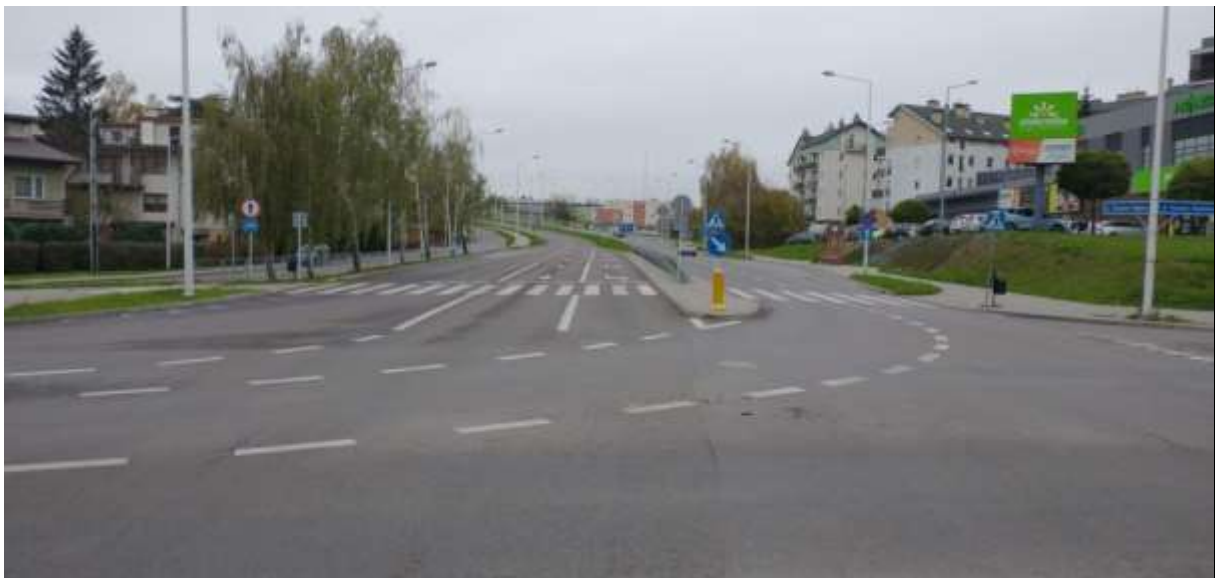
Zdjęcie 10 Absurdalnie szerokie przejście dla pieszych