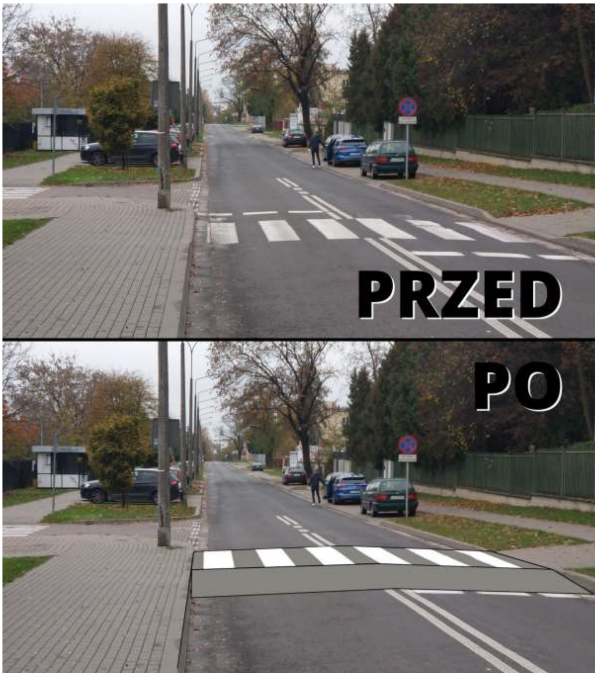
Zdjęcie 13 Wykonanie wyniesionych przejść dla pieszych na ul. Bazyliańówka, na której dopuszczalna prędkość to 30 km/godz