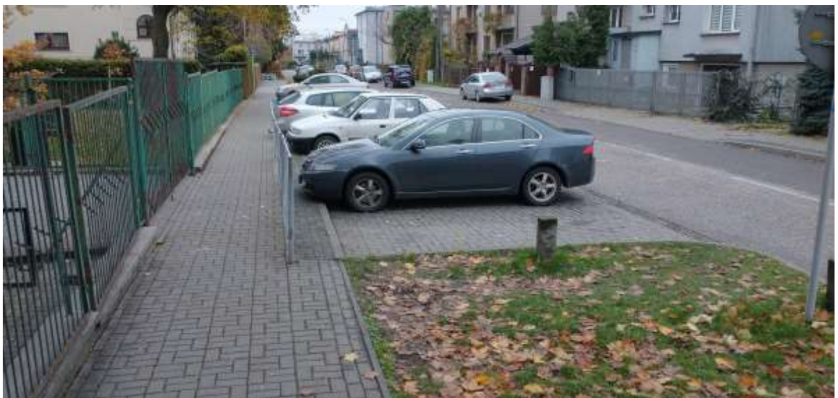
Zdjęcie 1 Zwązony chodnik przed wejściem do szkoły, po lewej widoczna szeroka brama wejściowa.