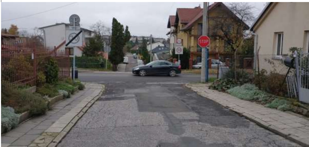
Zdjęcie 9 Strefy tempo 30 przedzielona ulicą Ponikwoda