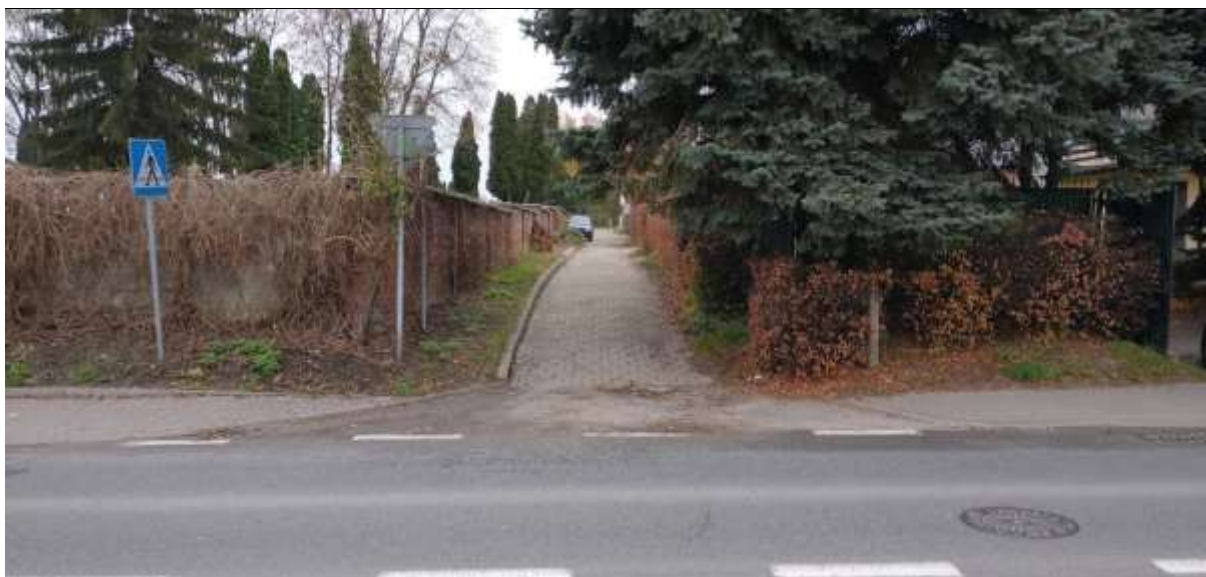
Zdjęcie 4 Ulica Łubinowa – możliwy skrót do szkoły