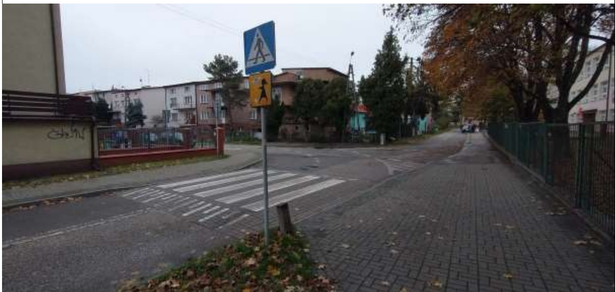
Zdjęcie 2 Wyniesione przejście bezpośrednio przed szkołą