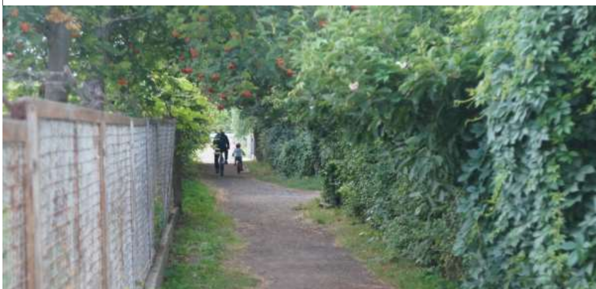
Zdjęcie 5 Ulica Łubinowa – możliwy skrót do szkoły (wzdłuż ogrodzenia CKU)