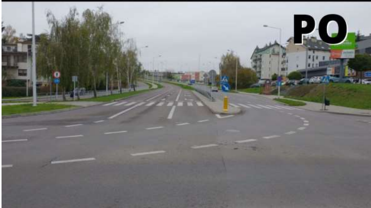
Zdjęcie 14 Ulica Węglarza - zwężenie przejścia o jeden, nieużywany pas ruchu