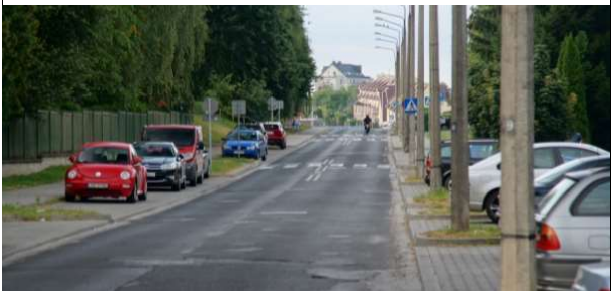
Zdjęcie 12 Ulica Bazyliańówka - prędkość dopuszczalna 30 km/godz.