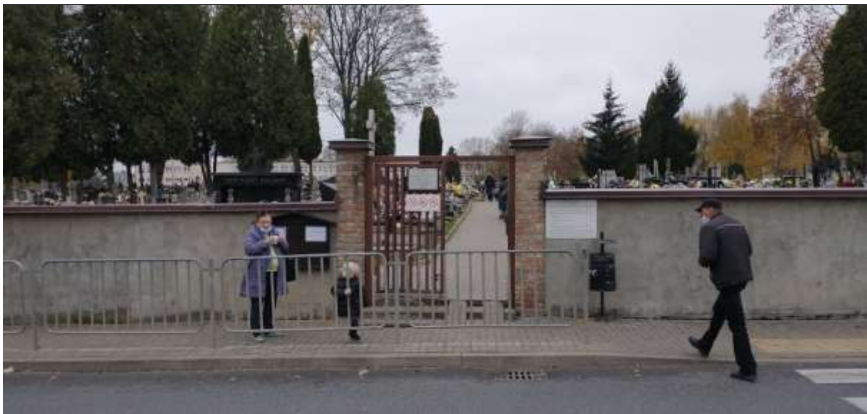
Zdjęcie 7 Skrót z przystanku do szkoły – przez cmentarz