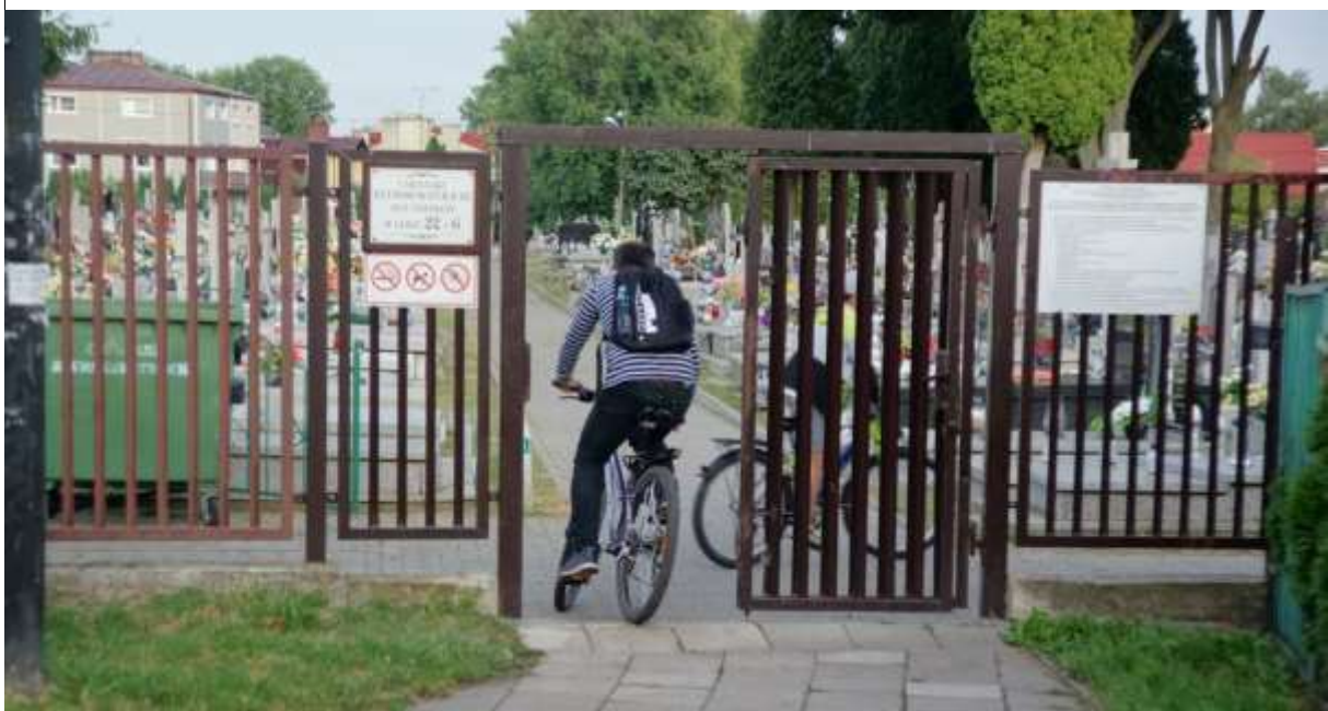
Zdjęcie 8 Skrót przez cmentarz, pomimo zakazu, chętnie jest też wykorzystywany przez rowerzystów