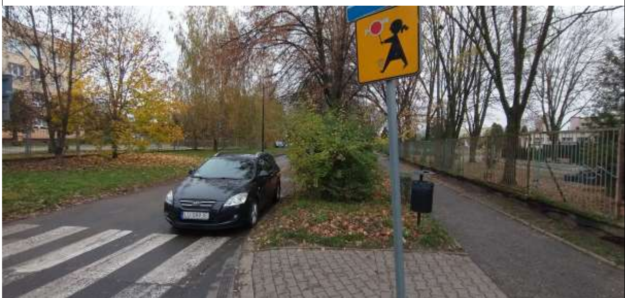
Zdjęcie 3 Krzak zasłaniający widoczność na przejściu